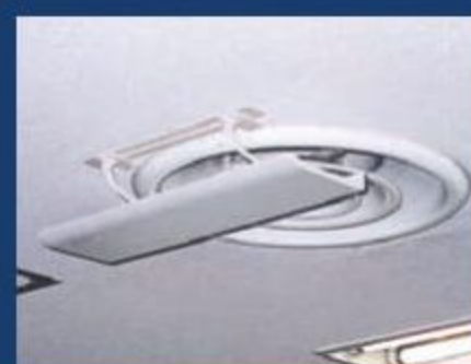
円型吹出しタイプ