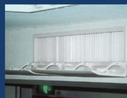
壁面吹出しタイプ