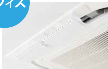
業務用エアコン設置例