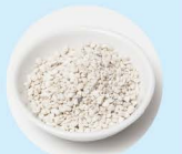
一定量を安定的に供給する顆粒タイプ

『JOKIN AIR PLUS II』は、独自研究により開発された顆粒タイプの二酸化塩素を採用。一般的な液体やゲル状では難しかった効果の持続性と安定性を実現させました。