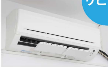
家庭用エアコン設置例