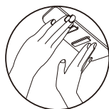
アダプターを しっかり 押し付けて固定

■アダプターを取り付ける際は、予め取り付け面を水拭き又は中性洗剤等で清掃し、十分に乾かしてから取り付けてください。