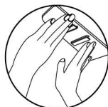
アダプターを しっかり 押し付けて固定

■アダプターを取り付ける際は、予め取り付け面を水拭き又は中性洗剤等で清掃し、十分に乾かしてから取り付けてください。