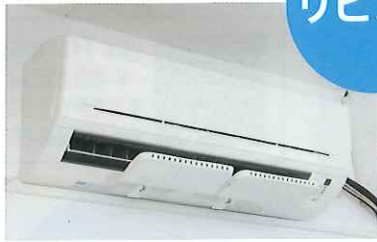
家庭用エアコン設置例