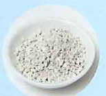
一定量を安定的に供給する顆粒タイプ

『JOKIN AIR PLUS』は、独自研究により開発された顆粒タイプの二酸化塩素を採用。一般的な液体やゲル状では難しかった効果の持続性と安定性を実現させました。